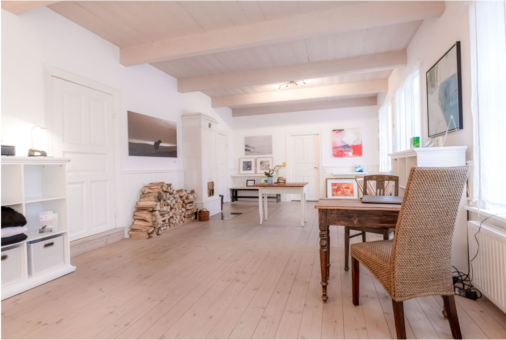
Südzimmer vom Eingang links (Raum 2)