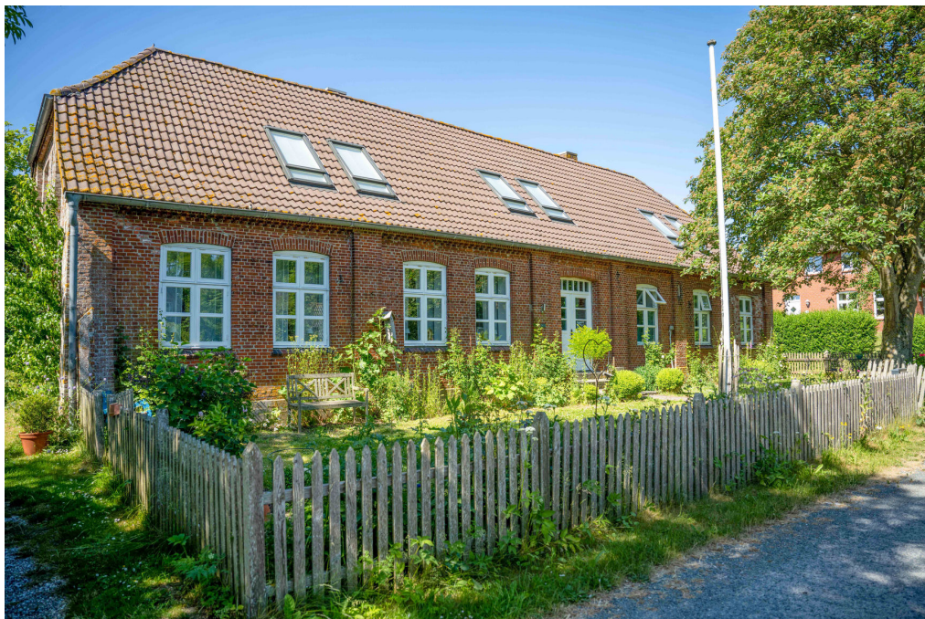
Vorgarten und Südansicht