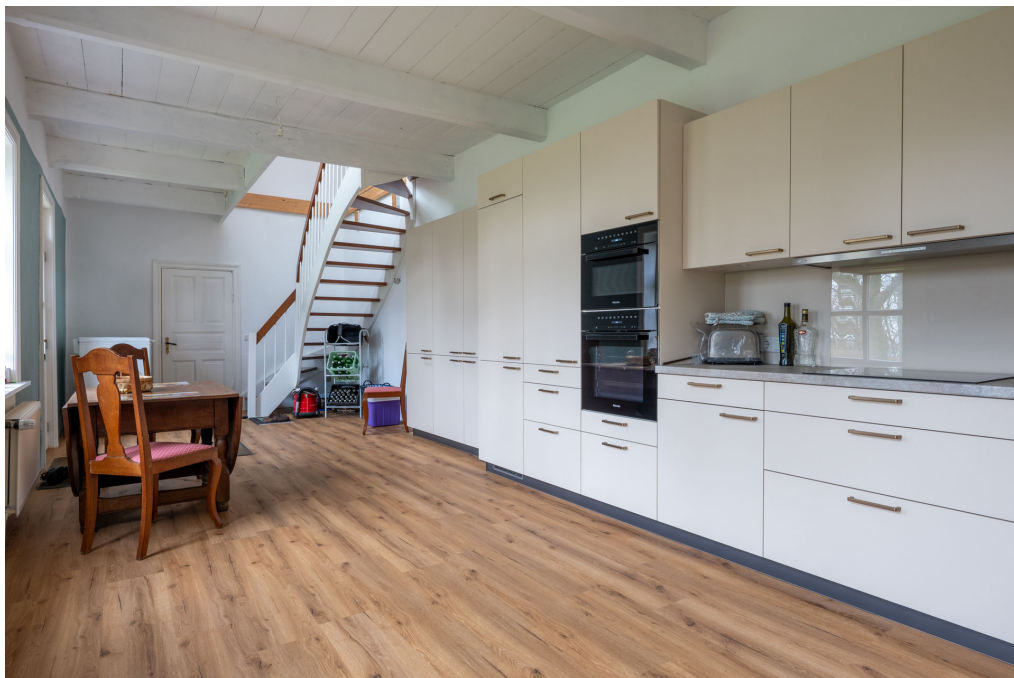
Wohnküche mit Zugang zum Dachgeschoss und in den Garten