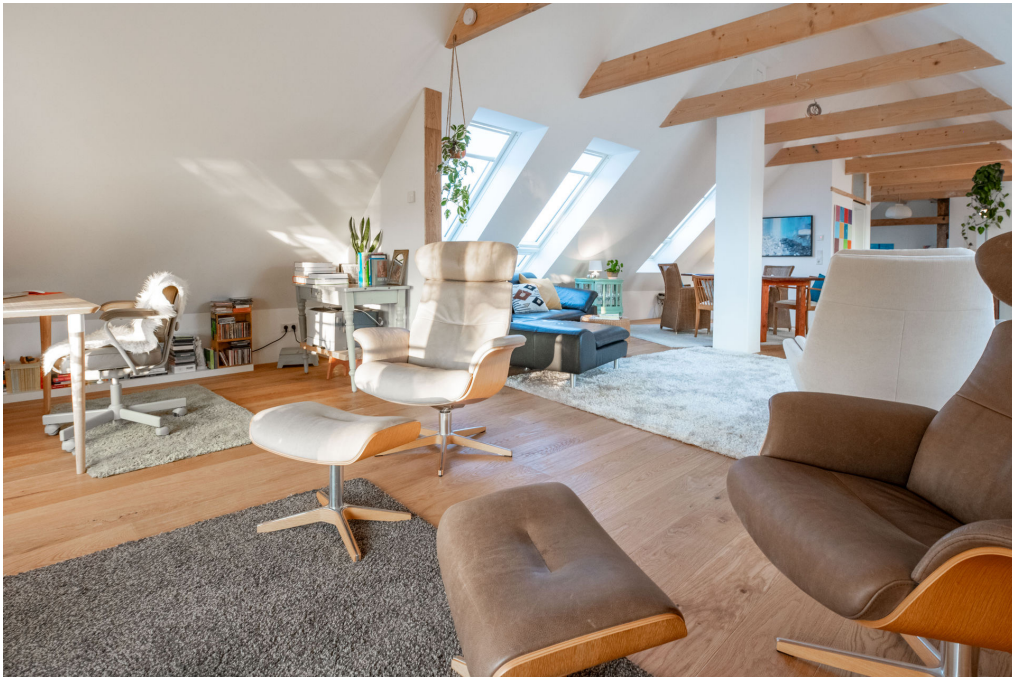
Viel Licht, behagliche Wärme