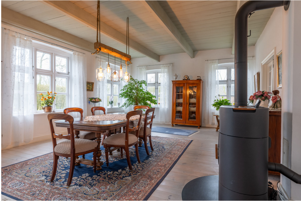
Südostzimmer (Raum 4)