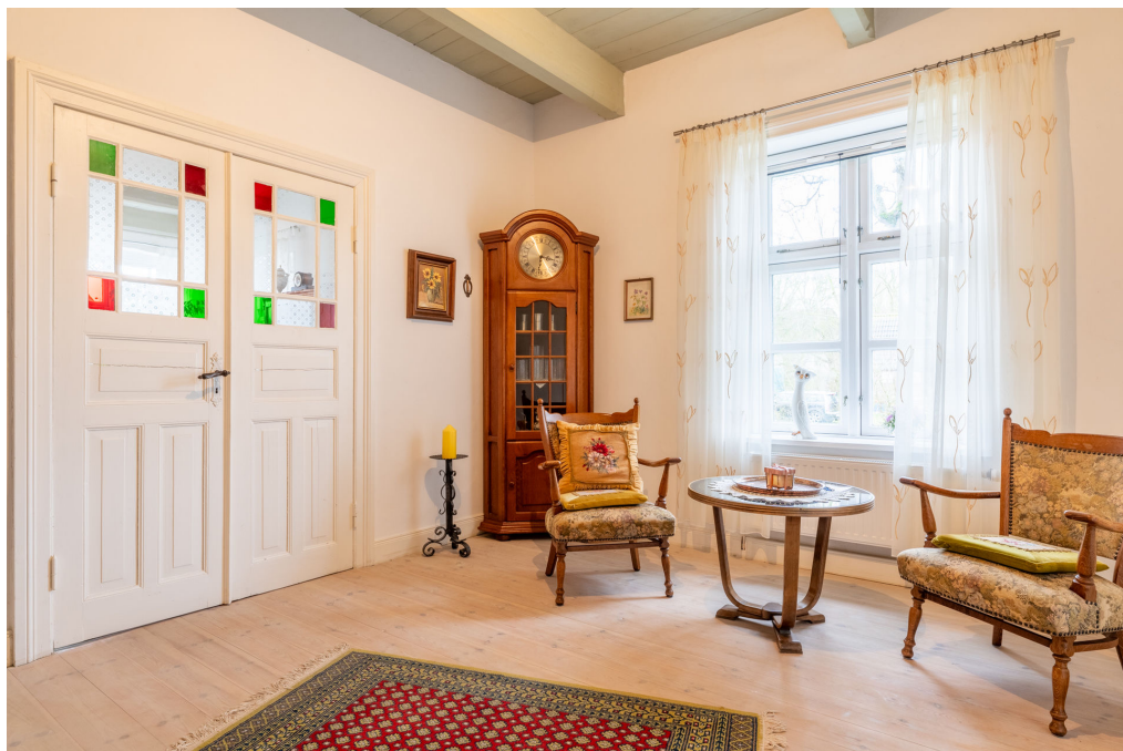
Südzimmer, rechts vom Eingang (Raum 3)