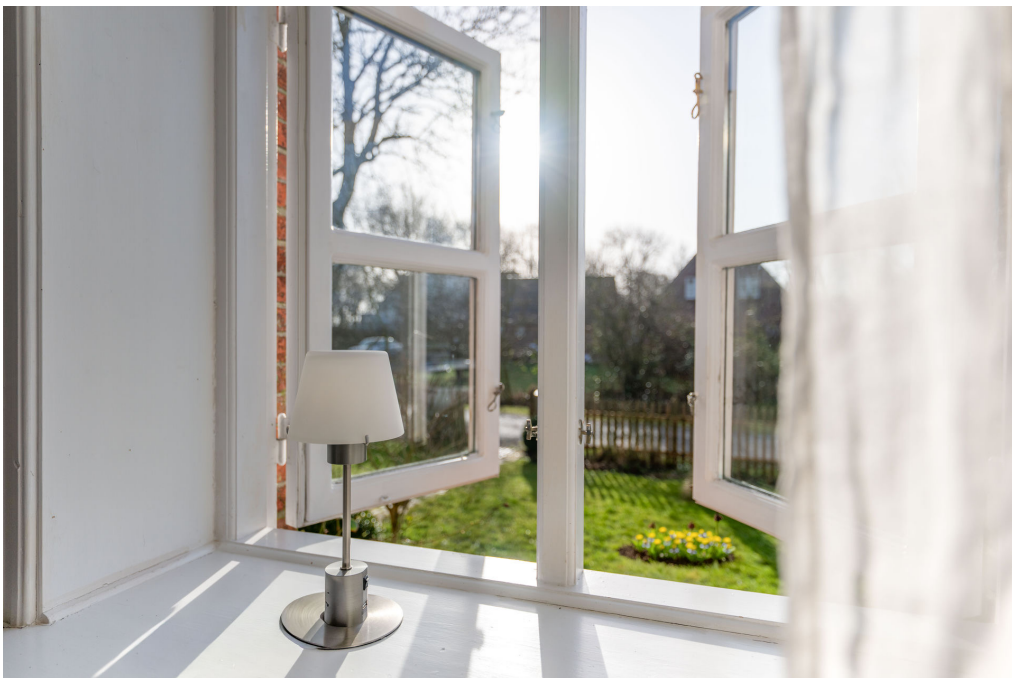
Blick nach draußen