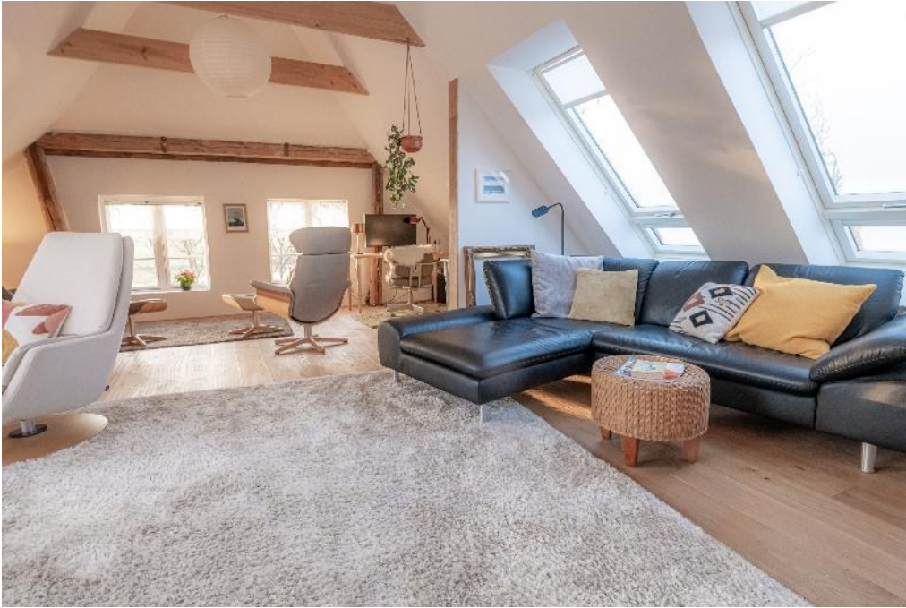
Großer, offener Wohnbereich im Dachgeschoss